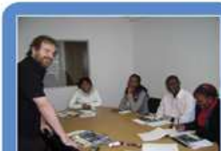
Séjour linguistique en Afrique du sud