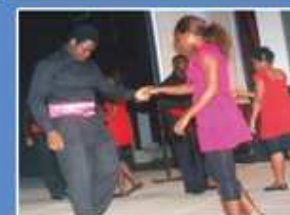
Activité de développement personnel