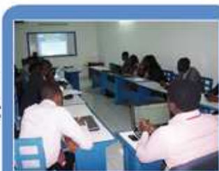
Séminaires & conférences