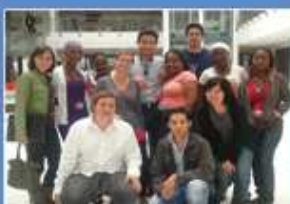
Séjour linguistique en Angleterre